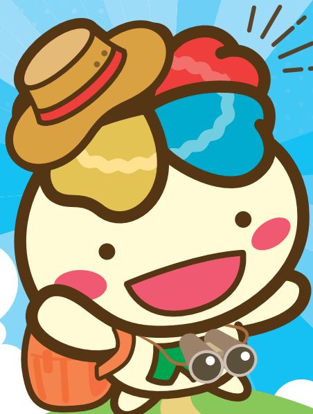
JA東京みどりキャラクター みどりん