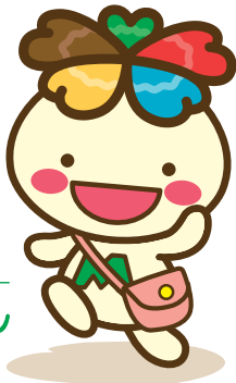
JA東京みどり キャラクター みーどりん