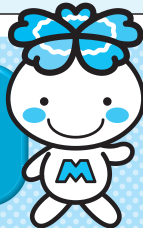
JA東京みどり キャラクター みーどりん

※原則、地区内(国立市・昭島市・立川市・武蔵村山市・東大和市)にお住まいの方、もしくはお勤めの方に限ります。